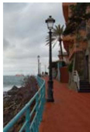
La bellissima passeggiata "Anita Garibaldi" sul lungomare di Nervi