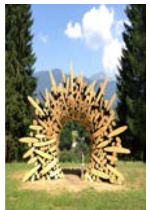
Fantasia scultura in legno presso Arte Sella

incontaminato, fantastico e quasi surreale. Cena e pernottamento in hotel a Lovran. L'ultimo giorno al mattino con la guida visiteremo la bellissima isola di KRK, in un tour panoramico che ci permetterà di effettuare un bel giro dell'area. L'isola è un susseguirsi di paesi affacciati sul mare molto diversi tra loro, ma tutti dotati di grande fascino. Allo stesso tempo mantiene le caratteristiche di un'isola adriatica: coste frastagliate ricche di baie e insenature, innumerevoli isolotti, spiagge di scogli, ciottoli e sabbia, vegetazione rigogliosa con pinete e macchie di querce che scendono fino al mare. Concluderemo con un buon pranzo a base di carne in un ristorante della zona. Rientro a RE per le ore 21.30 circa.