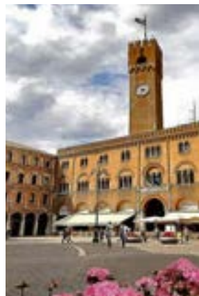
Il palazzo del Trecento con la bellissima Torre Civica, sono il cuore storico di Treviso