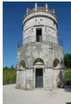
L'incantevole Mausoleo di Teodorico a Ravenna

murarie e le varie porte. Un territorio stupendo con vigneti incantevoli che nel corso degli anni ha conservato un fascino del tutto particolare. Al termine visita in enoteca del paese. Pranzo libero in centro a Vicenza. Nel pomeriggio si potrà visitare liberamente Vicenza e svariate sono le possibilità: Teatro Olimpico, Basilica Palladiana, Piazza dei Signori, Palladium Museo.