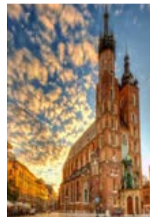
La bellissima basilica di Santa Maria a Cracovia

I corsi relativi ai balli di gruppo messi in programma dall'area benessere UISP sono già affermati da molto tempo. Si tratta di corsi che cercano di coniugare il movimento con l'insegnamento, la musica con il divertimento. Naturalmente i vari corsi sono strutturati tenendo conto dei vari gradi di apprendimento dei partecipanti. Le iscrizioni si effettuano direttamente in palestra. La prima lezione del corso per principianti e della Zumba è gratis. L'abbonamento da 5 lezioni costa € 35; L'abbonamento da 10 lezioni costa € 60; una singola lezione costa € 7;