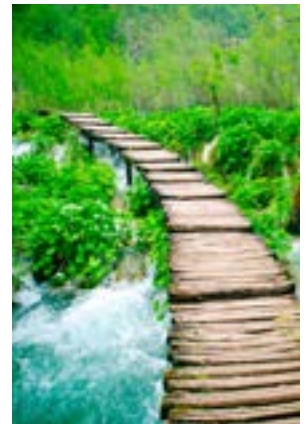
Le palizzate in legno ai laghi di Plitvice

custodire e tramandare. Pranzo libero in centro a Firenze. Al pomeriggio effettueremo un ampio percorso con la guida per ammirare gli angoli più belli e caratteristici della città. La visita sarà concentrata nel centro storico e visiteremo: Basilica di Santa Croce, Palazzo del Bergello, Piazza della Signoria, Palazzo Vecchio e Loggia dei Lanzi, Galleria degli Uffizi, Pontevecchio, Piazza della Repubblica, Cattedrale (con visita interna), Battistero di San Giovanni, Basilica di San Lorenzo a Cappelle dei Medici. La visita di tutti questi esterni si concluderà verso le ore 17.00 e prima della ripartenza rimarrà circa 1.30 a disposizione degli ospiti per concludere liberamente la visita della città.