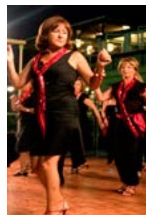
Corso dei balli di gruppo UISP