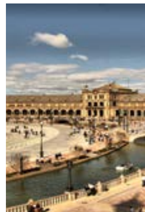
L'affascinante Plaza de España di Siviglia

Il costo è di € 295 a persona in camera doppia, € 325 in singola, comprensivo di viaggio in pullman, guida per le tre giornate, due mezze pensioni in hotel, più due pranzi in ristorante, pranzo/de gustazione e visita in cantina, ingresso al castello di Bard, assicurazione sanitaria e accompagnatore. Per chi rinuncia al viaggio a meno di 15 giorni dalla partenza, penale di € 90 a persona.