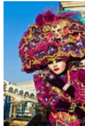
Tradizionale maschera del Carnevale di Venezia

Le 6 sezioni dell'esposizione presso il Museo di Santa Caterina a Treviso ci consentiranno di seguire un cammino tra capolavori che hanno segnato una delle maggiori rivoluzioni nella storia dell'arte di tutti i tempi. Una mostra veramente unica e molto curata, con opere provenienti dai maggiori musei del mondo.