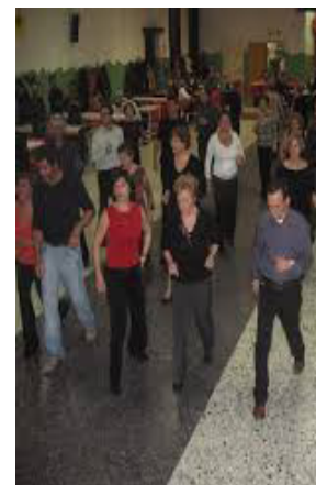
Corso di Ballo

Un cuore allenato è un cuore più forte, accompagna momenti di buon umore e ci permette di vivere meglio e più a lungo.