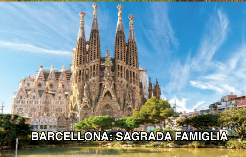
BARCELLONA: SAGRADA FAMIGLIA

UN ALTRO QUADRIMESTRE D'INTENSE ATTIVITA' MOTORIE PER MIGLIORARE IL NOSTRO BENESSERE