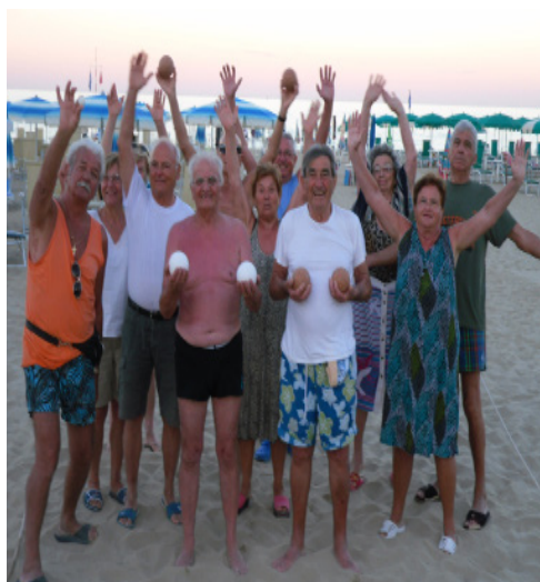
Vacanza ad Alba Adriatica

Il costo della gita è di € 65 a persona, comprensivo del viaggio in pullman, ingresso alla casa museo dell'Artusi, guida a Forlimpopoli, pranzo completo di pesce e accompagnatore. A meno di otto giorni dalla partenza, non si effettuano rimborsi.