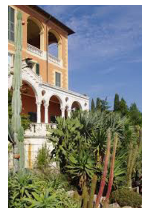
I giardini Hanbury

Nei viaggi e nei soggiorni della UISP c'è sempre un accompagnatore in grado di assistere le persone che sono in difficoltà. Nessuno viene abbandonato a se stesso!