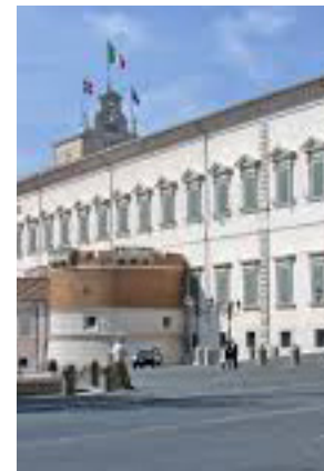
Palazzo del Quirinale

Concluderemo la visita in piazza della Repubblica, gli interni della Basilica di Santa Maria degli Angeli e le bellissime chiese di San Carlo e S. Andrea. Pomeriggio a disposizione per visite libere a musei o per lo shopping. Ore 18:00 ritrovo in hotel, partenza con il treno alle ore 19:00 arrivo a Reggio alle ore 21:00 circa.