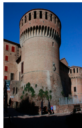
Rocca di Dozza

La quota comprende: viaggio di A/R in aereo, transfert da e per gli aeroporti, visite e ingressi come da programma (Sagrada Famiglia, Parco Guell, Museo Gaudì) tre mezze pensioni in hotel, l'assicurazione sanitaria, l'assicurazione annullamento, l'accompagnatore. Disponibili massimo 30 posti. Iscrizioni assolutamente entro la fine di febbraio. Caparra € 150 a persona, saldo almeno 20 giorni prima della partenza.