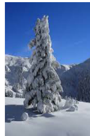
Val di Fassa

I prezzi sono comprensivi di mezza pensione, bevande, colazione a buffet, assicurazione sanitaria, accompagnatore UISP. Viaggio con mezzi propri. Riduzioni: bambini 3/11 anni in camera con due adulti gratis; 12/17 anni in camera con due adulti sconto 50%. All'iscrizione si versa una caparra di € 100,00 a persona, saldo almeno 15 giorni prima di partire. In caso di rinuncia al viaggio a meno di 15 giorni dalla partenza la penale è di € 90 a persona. Con un numero minimo di partecipanti, è possibile effettuare al netto delle spese il trasferimento in pullman. Per info e iscrizioni: 0522/267215 - 0522/267209 Daniela Prandi