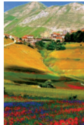
L'altopiano di Castelluccio

trifogli, acetoselle e tant'altro. Il primo giorno arriveremo ad Alba Adriatica e pranziamo all'hotel Baltic. Nel pomeriggio visita guidata della bellissima Ascoli Piceno, ci inoltreremo nell'incantevole centro storico (Piazza del Popolo, Duomo, Ponte Romano, Piazza Arringo) per esplorare le sue meraviglie. Cena e pernottamento in hotel. La seconda giornata al mattino, sarà dedicata alla visita guidata dell'altopiano di Castelluccio. Effettueremo il pranzo in un noto ristorante della zona e rientreremo a Reggio Emilia in serata.