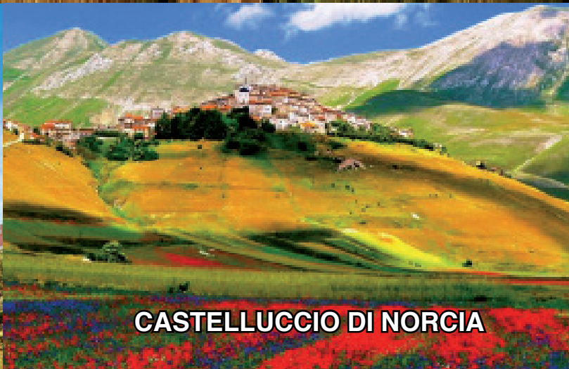
CASTELLUCCIO DI NORCIA