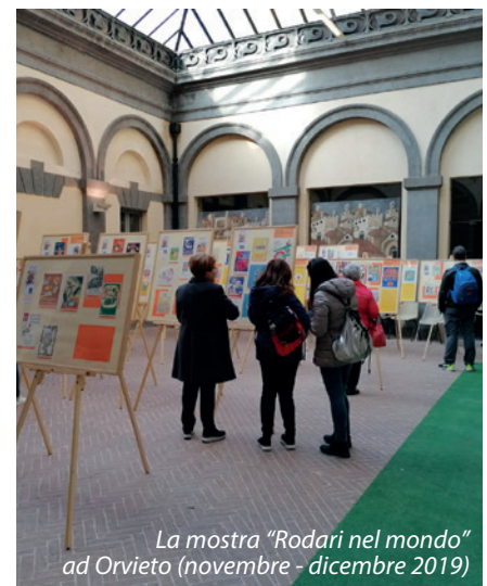
La mostra "Rodari nel mondo" ad Orvieto (novembre - dicembre 2019)