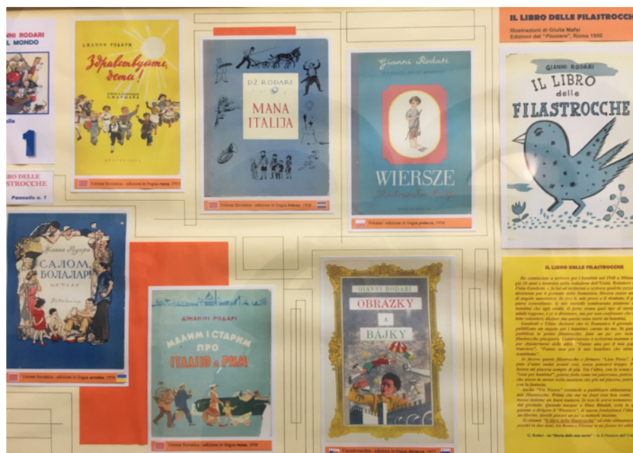
Un pannello della mostra "Rodari nel mondo" ad Orvieto (novembre - dicembre 2019)

C i fermiamo qui, avendo crediamo questo stralcio già detto molto, aggiungendo soltanto che Biscardi sembra abbia scelto il titolo della sua fortunata trasmissione proprio richiamandosi a quella prefazione di Rodari, laddove questi sosteneva occorresse parlare del calcio "come di un processo". Comunque sia e con un "senno di poi" puramente accademico, resta da chiedersi se Rodari, prematuramente scomparso proprio in quel 1980 in cui nasceva " Il processo del lunedì ", potendolo vedere non si sarebbe in qualche modo pentito delle sue generose e amicali parole. Probabilmente sì: ma tutto ciò fa parte d'uno di quegli scherzosi giochi linguistici sul "periodo ipotetico" che tanto piacevano al nostro Rodari, inimitabile inventore della "Grammatica della fantasia".