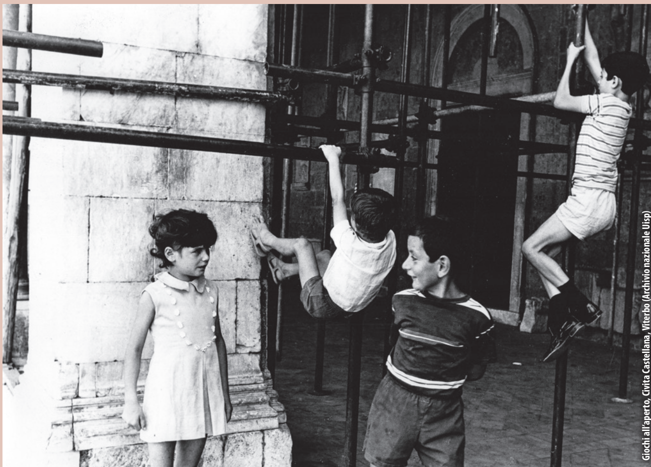
Giochi all'aperto, Civita Castellana, Viterbo (Archivio nazionale Uisp)

(Gianni Rodari: "Manuale del Pioniere", Edizioni di cultura sociale, Roma 1951 fonte: www.ilpioniere.org , Fondazione Gramsci Emilia Romagna)