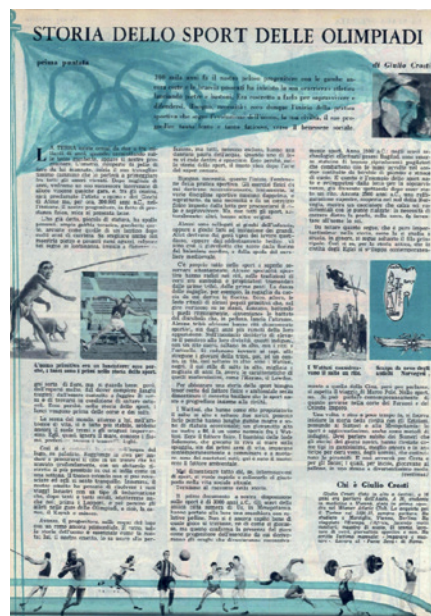
Una pagina de Il Pioniere dedicata interamente allo sport (n° 1 anno XI del 3 gennaio 1960)